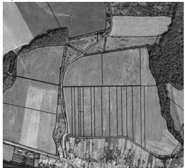
stav po pozemkových úpravách